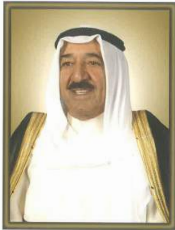
صاحب السمو الشيخ أحمد الجابر الصباح أمير دولة الكويت