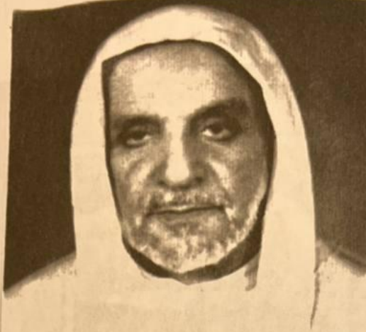
(صورة للشيخ / أحمد الخميس التقطت له في فترة الستينيات)