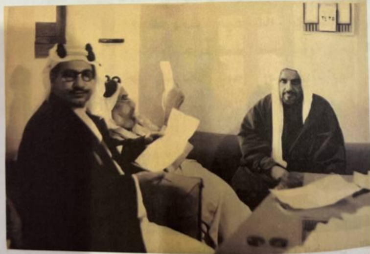
صورة التقطت في عام 1951 م أثناء فرز أصوات المنتخبين في أول مجلس للصحة ويبدو من اليمين الشيخ / أحمد الخميس ثم الشيخ / يوسف بن عيسى القناعي ثم الشيخ / عبدالله الجابر الصباح.